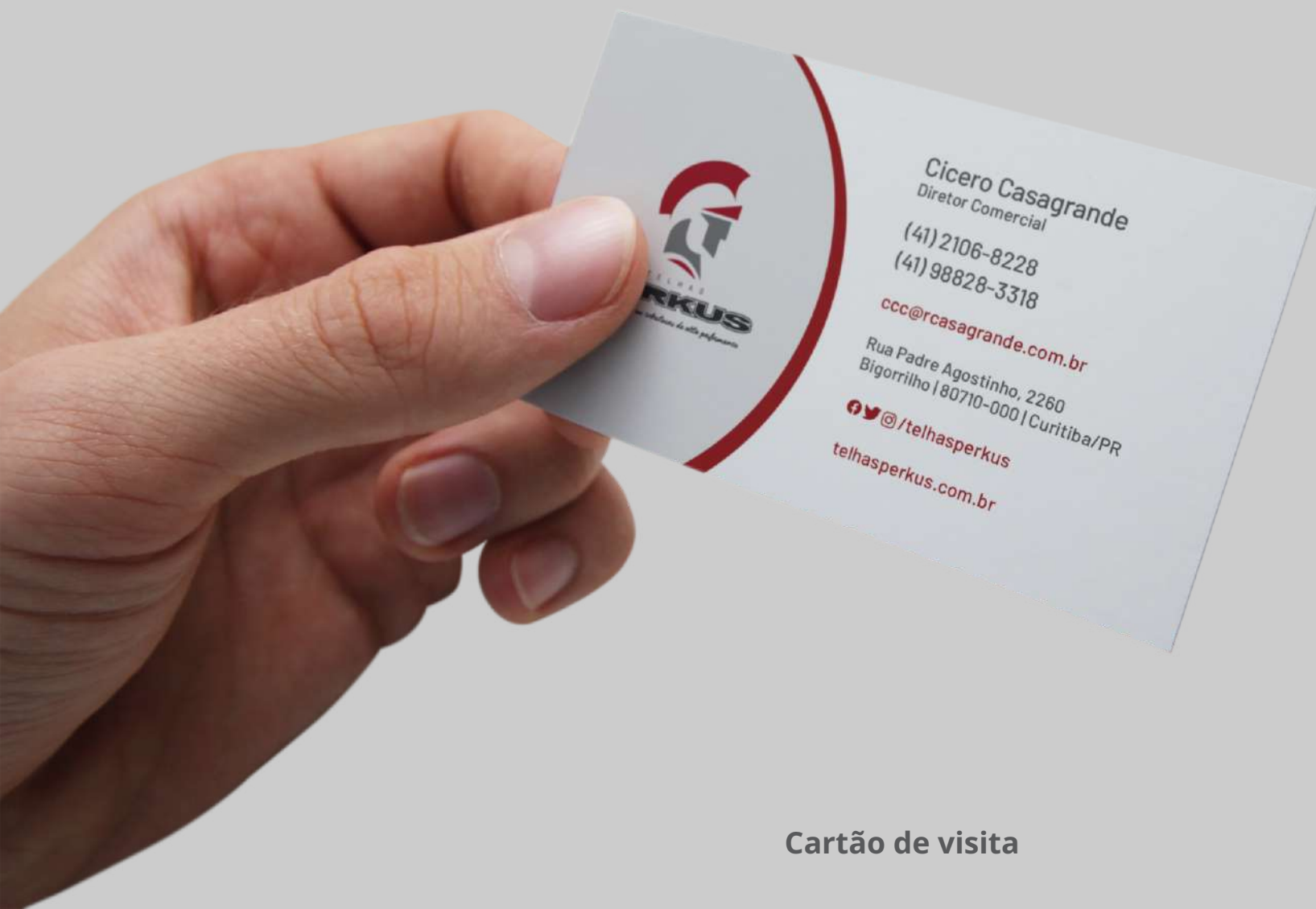
Cartão de visita